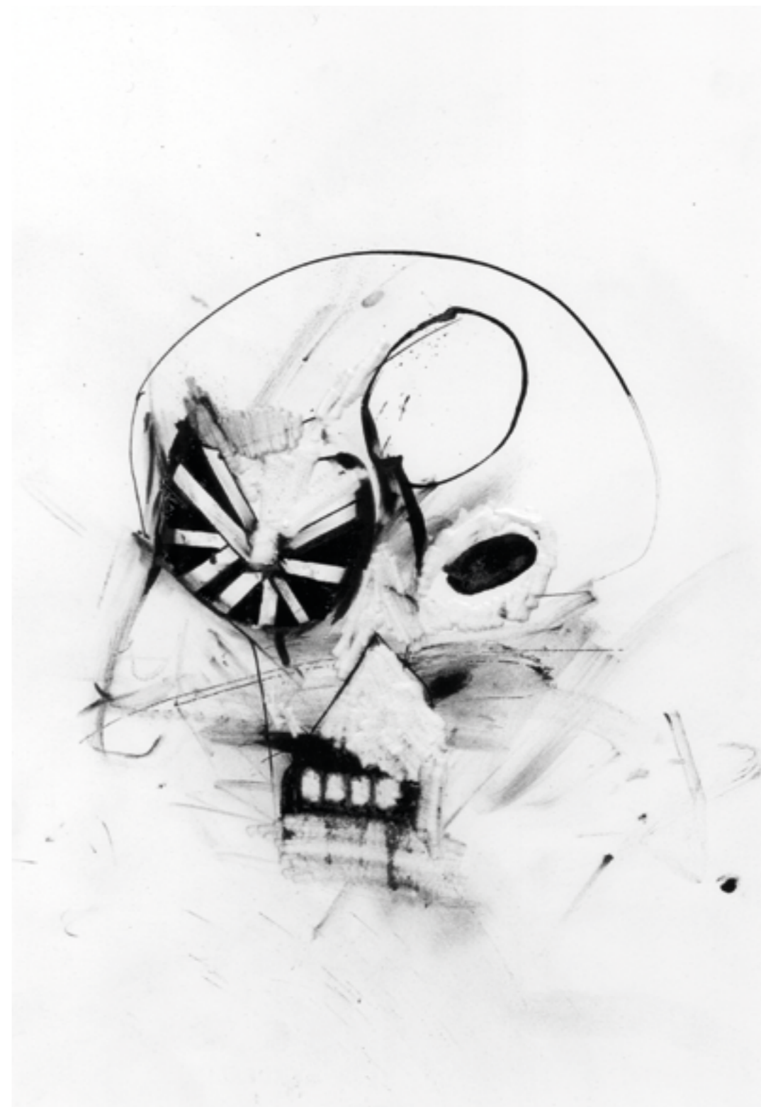
DESSIN : CHRISTOPHE BRUNNQUELL